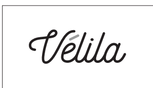
En niveaux de gris, sur fond blanc