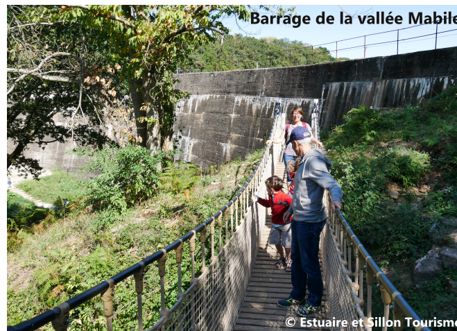
Barrage de la vallée Mabile

Cette zone tampon rend également d'autres services : elle préserve des inondations, améliore la qualité des eaux, garde de la fraîcheur et de l'eau en période de sécheresse et accueille une grande diversité tant animale que végétale.