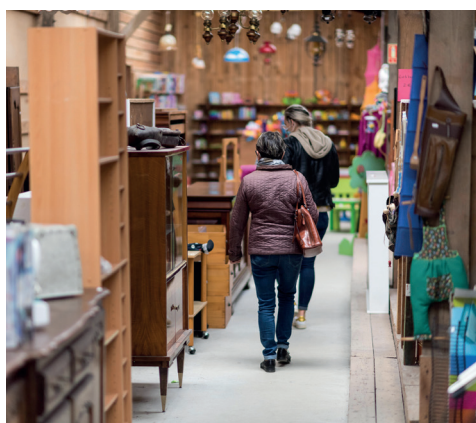
Boutique solidaire / dépôt Recyclerie Nord Atlantique Le Point du Jour - 44260 Savenay 02 40 05 38 21 Tous les horaires sur : recyclerienordatlantique.org/nos-boutiques-solidaires

L'équipe de la Recyclerie collecte des objets variés principalement sur ses lieux de dépôts et en déchèterie : articles textiles, de vaisselles, meubles, livres, jeux-vidéos, ameublement de jardin, jouets... Après la collecte, les équipes pèsent et classent les objets pour assurer leur traçabilité. Suivant l'appréciation de leur état, les objets seront valorisés et revendus à tarif solidaire dans l'une des quatre boutiques de la Recyclerie (Savenay, Blain, Drefféac, Nort-sur-Erdre) ou donnés à des associations partenaires locales. Les objets ne répondant pas aux critères seront orientés vers la bonne filière de recyclage pour un traitement spécifique.